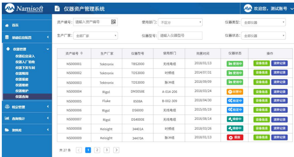
图 4.9 仪器信息查询