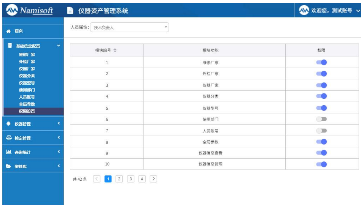
图 4.5 账号权限设置