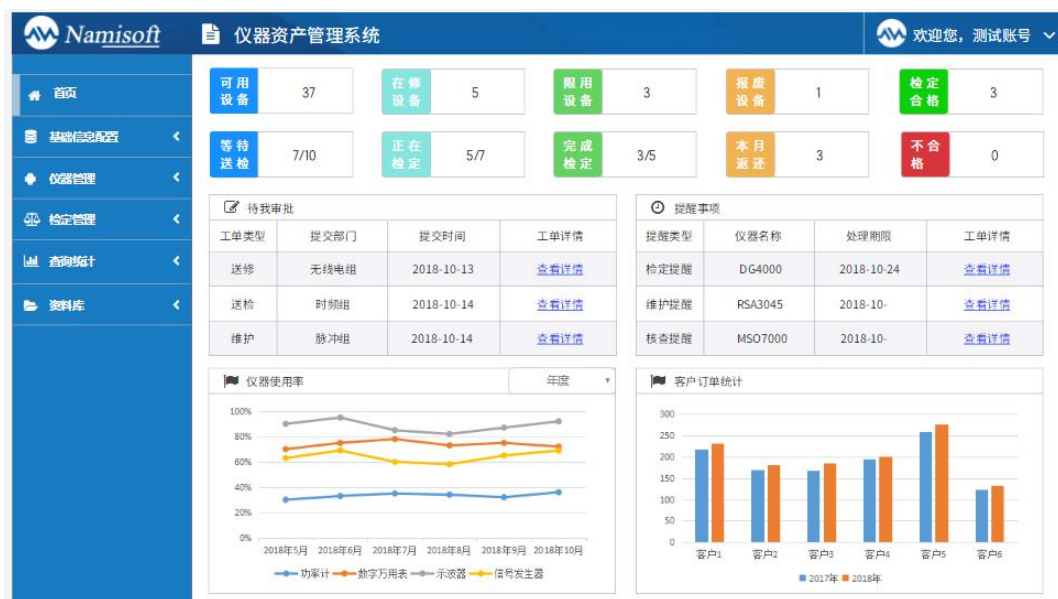
图 4.1 系统首页