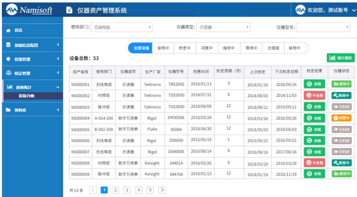
图 4.13 仪器设备管理台账