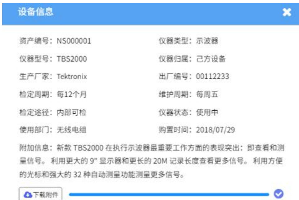
图 4.10 仪器信息显示