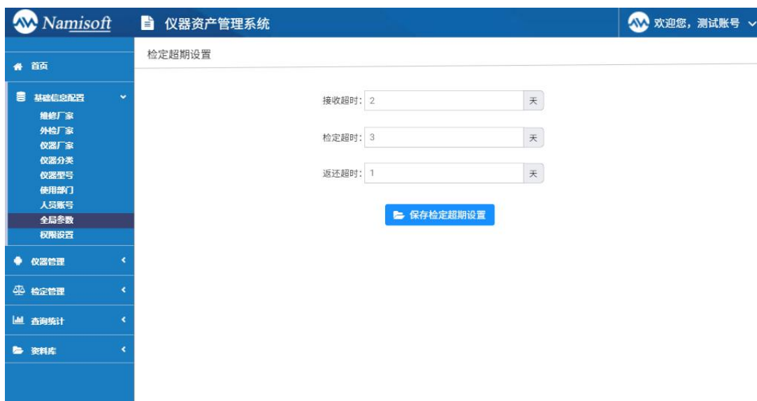
图 4.6 全局参数配置