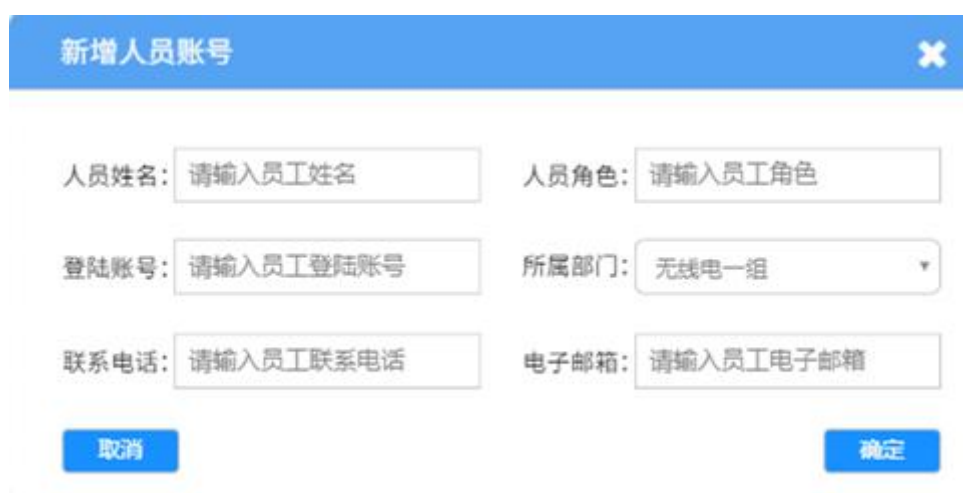
图 4.4 人员账号信息录入

管理员可对系统使用人员信息进行增删查改等编辑，并设置普通账号数据产看权限，保证管理信息的安全性。