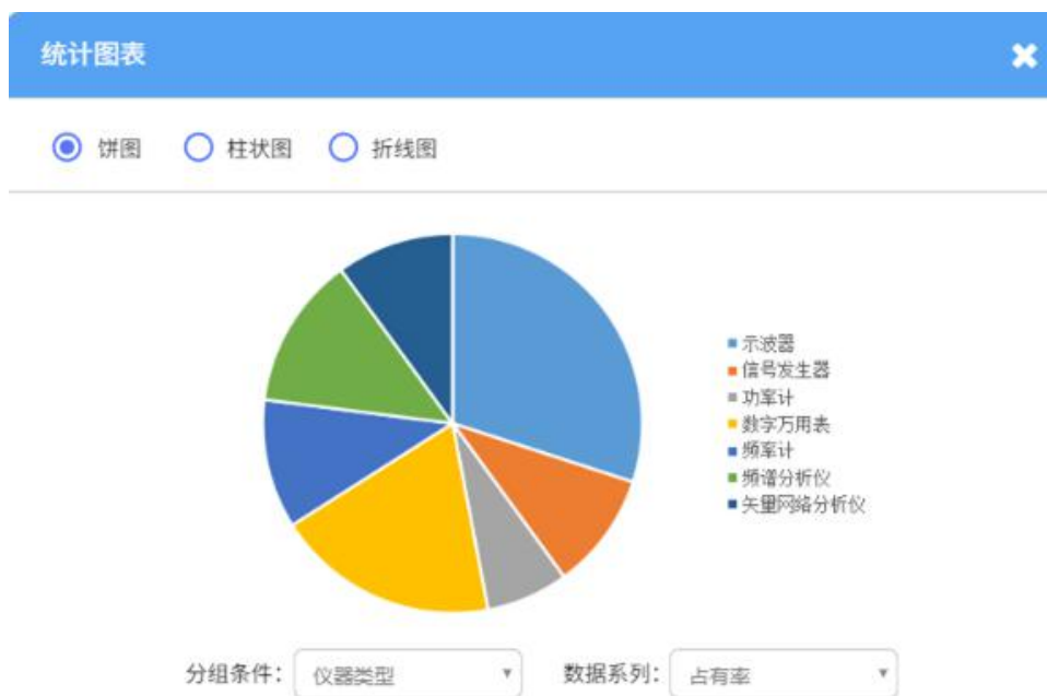
图 4.14 仪器设备统计信息