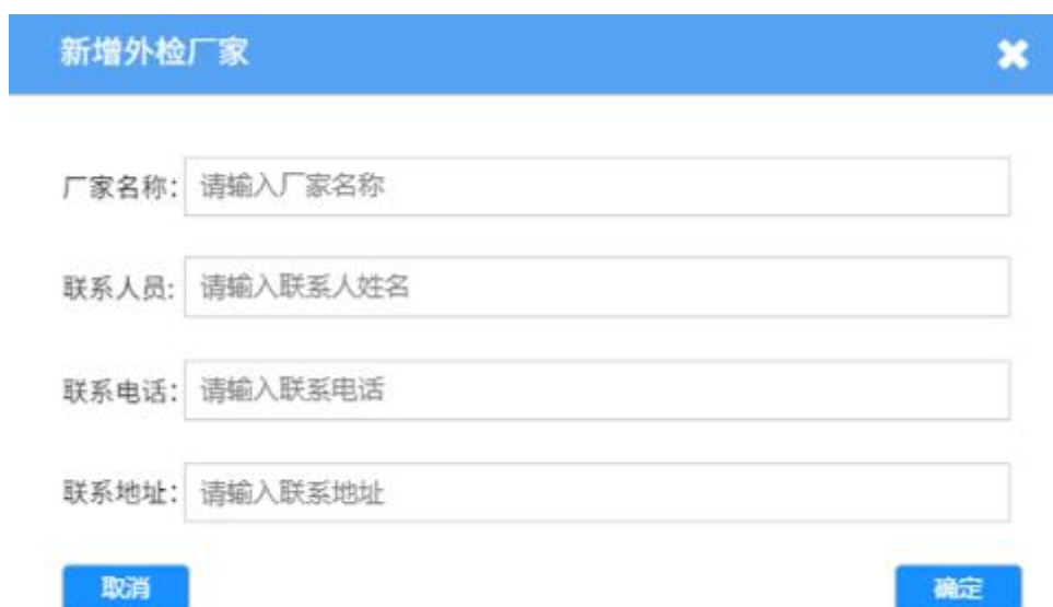
图 4.3 外检厂家基础信息配置

以外检厂家基础信息配置为例，该模块需要在系统中录入外检厂家的详细信息，包括厂家名称、联系人、联系电话、联系地址等信息；若为仪器基础信息配置则需要录入仪器厂家、种类、型号等信息。