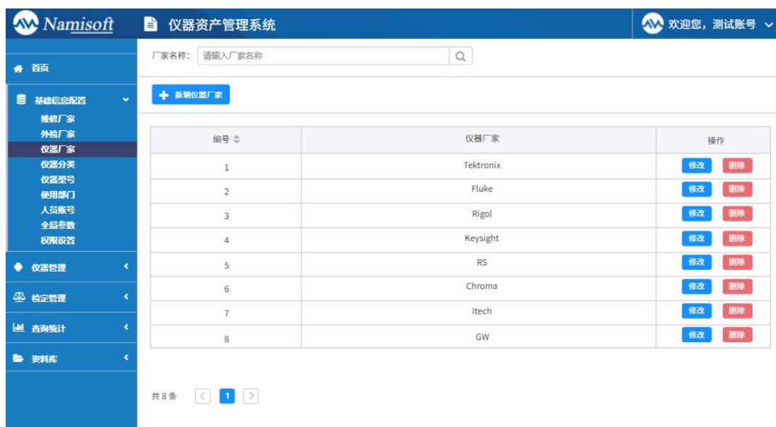
图 4.2 基础信息配置

基础信息配置包括：维修厂家、外检厂家、仪器厂家、仪器分类、仪器型号、使用部门、人员账号、全局参数、权限设置九大部分。