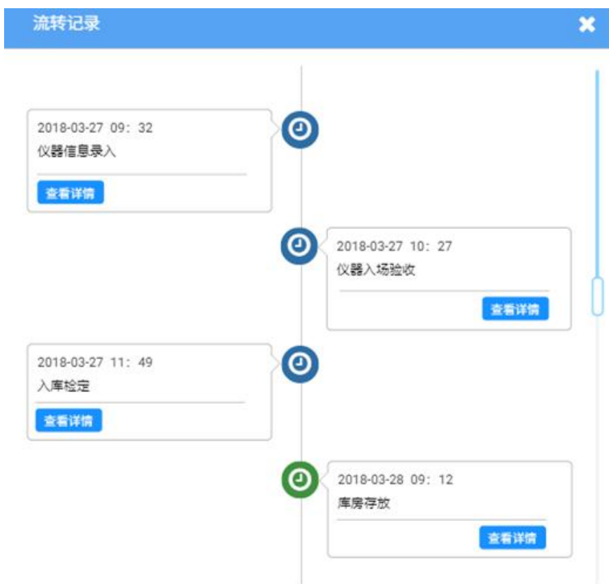
图 4.11 仪器流转信息记录